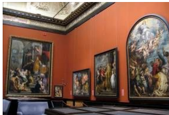
Фото 4 Великий Рубенс

Только на одном этаже музея собраны такие произведения, как «Охотники на снегу» Брейгеля, автопортрет Рембранта, «Шубка» Рубенса, «Поклонение святой Троице» Дюрера, «Вавилонская башня» Брейгеля ст., «Цыганская мадонна» Тициана и многие, многие другие. Это – нельзя передать словами. Это – надо видеть!