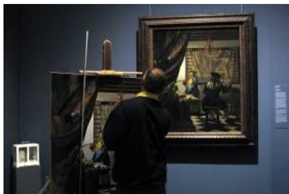
Фото 2 – мастера учатся у Мастеров (Вермеер «Искусство живописи»)

Был открыт в 1891 г., приказ о строительстве которого был отдан императором Францем Иосифом I в 1858 г. Построен в стиле итальянского Ренессанса по проекту Готфрида Зампера и барона Карла фон Хазенауера. Среди его собраний - нидерландская, фламандская, немецкая, итальянская, испанская и французская живопись.