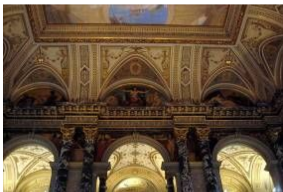
Фото 1 – центральная лестница

1. Музей истории искусств ( Kunsthistorisches Museum ) — известнейший художественный музей в Вене.