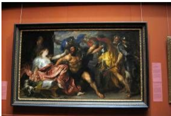
Фото 3 Антонис ванн Дейк «Пленение Самсона»